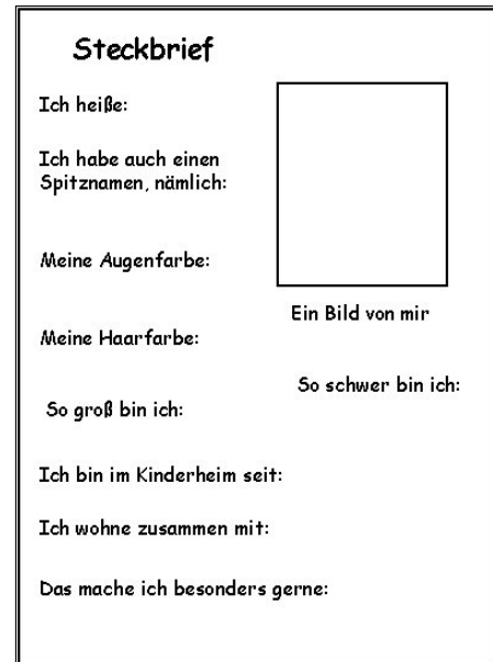
Abb. 2: Steckbrief. (B. Lattschar)