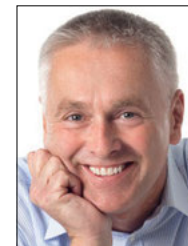
Leitung: Gerd W. Stolp | Tutzing Dipl. Mental-Coach, Trainer und Berater, zertifizierter Trauerredner und Trauerbegleiter BDVT www.stolp-online.de

Auch ganz praktische Dinge werden wir besprechen wie z.B. Begräbnisrituale und Bestattungsvorsorge. Vorsorge ist Fürsorge für mich und meine Angehörigen. Es beruhigt, wenn wir gut auf das vorbereitet sind, was unausweichlich ist.