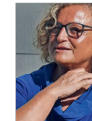
Leitung: Susanne Hölzl | Göming ZÜNDHÖLZL e.U., Unternehmensberatung & Training, Supervision & Coaching, Lehrtrainerin für Biografiearbeit nach LebensMutig e.V. www.zuendhoelzl.at

Miteinander Schritte tun, auf Gegangenes zurückschauen, in den Zwischenwelten verweilen, neue Wege in Betracht ziehen und neue Spuren vorbereiten.